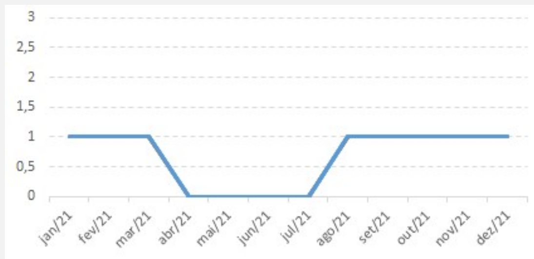
Evolução dos atendimentos

Em 2021 o Senai/PR atendeu a 8 registros de manifestações no canal Ouvidoria, em comparação com os 22 registros do ano anterior.