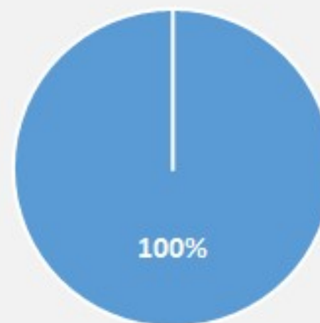
Tipo de Manifestação